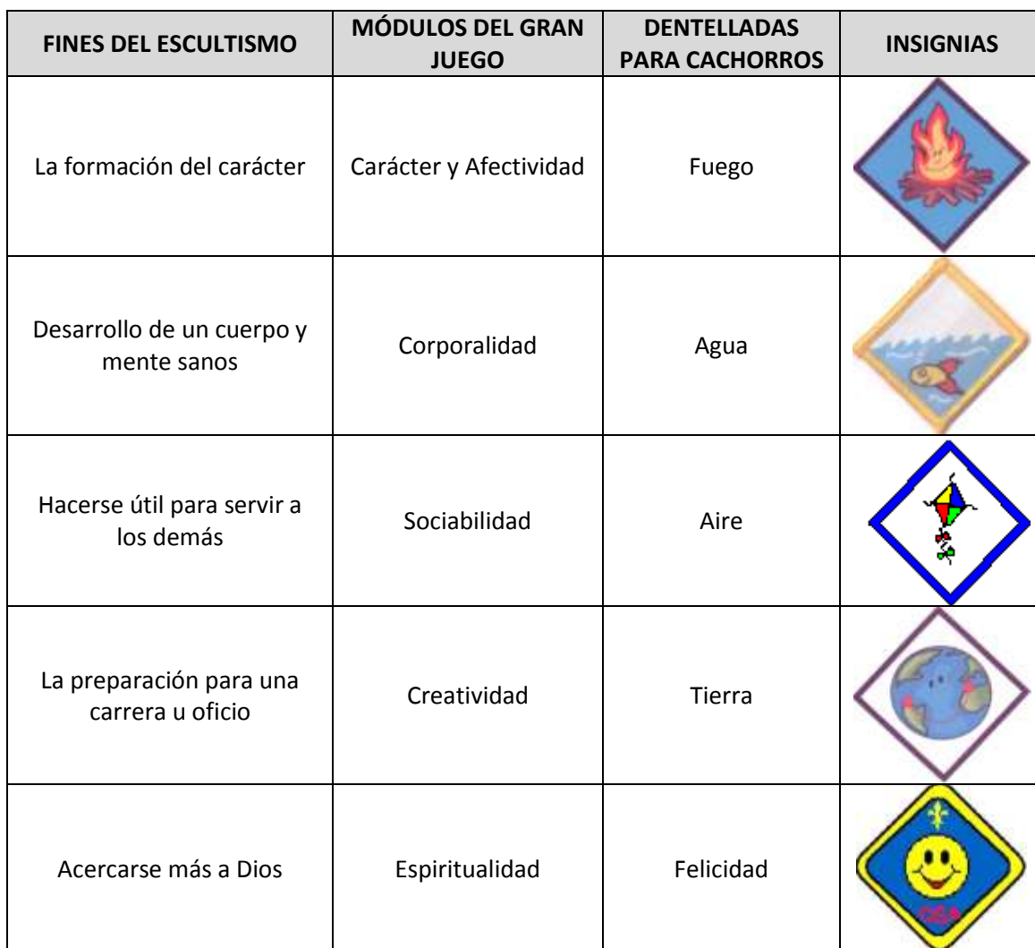
Tabla 1: El Gran Juego.